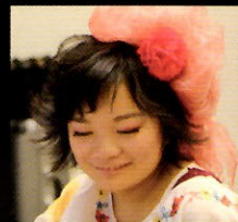
ゲスト：「奇蹟の歌姫」若渚